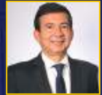
Coronel Alírio Villasanti