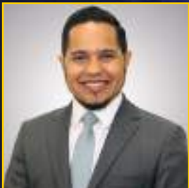
Papy 2º Secretário